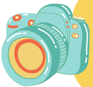
Foto- und Videografie, Foto- und Videobearbeitung, Langzeitbelichtung, Fotoshootings (Rauchbomben, Holifarben)! Alles geht!